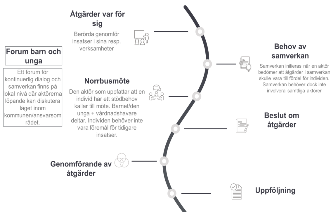
Bild över samverkansprocessen

Efter mötet ska samtliga aktörer självständigt, eller i samarbete, genomföra de insatser som beslutats om. Den som kallat till mötet, eller om mötet beslutat att någon annan part ska ta över ansvaret, ser till att aktörerna kallas till uppföljande möte.